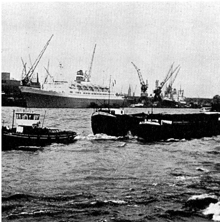
Ozeandampfer, Kräne, Schleppkähne, typisches Hafengebilde von Rotterdam