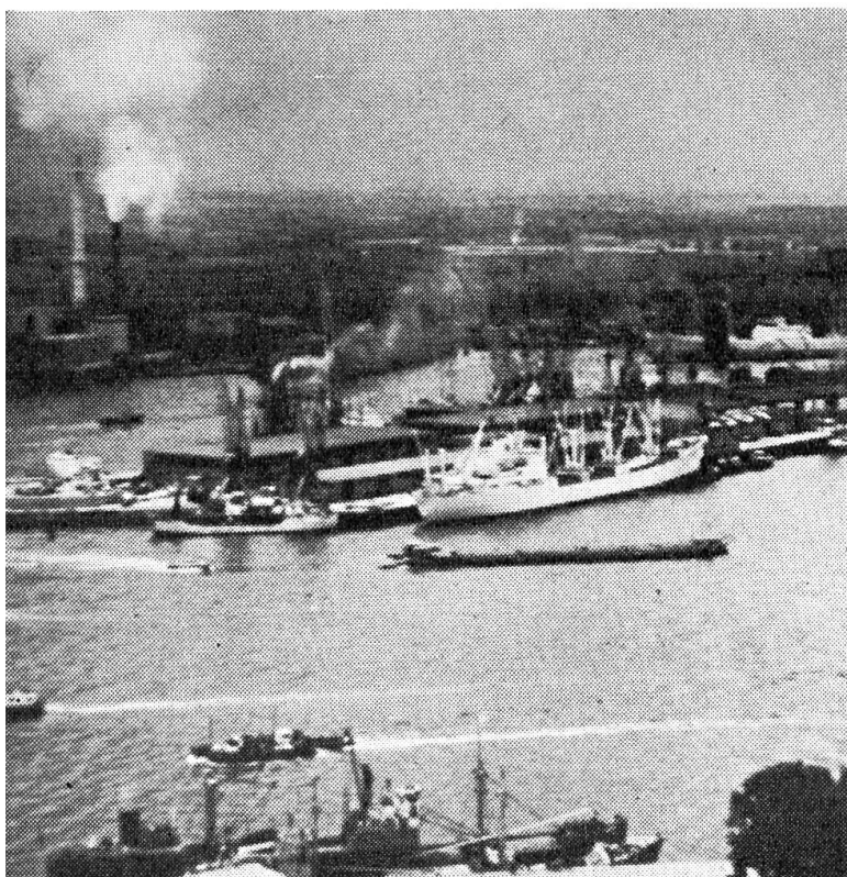
Rauchende Fabrikamine und reger Verkehr zu Wasser

Wohnhäuser. Wir hatten freien Einblick in die unteren Wohnräume, weil die Vorhänge merkwürdigerweise nur bis zu einem Viertel oder gar nur bis zur Hälfte herunterreichten. — Vor jedem Eingang zur untersten Wohnung beobachteten wir links und rechts je einen Spiegel. In diesen können die Bewohner einen Besucher sehen, ohne selber gesehen zu werden. Praktisch, wenn ein unerwünschter Gast vor der Türe steht! — In die obere Wohnung eines Hauses gelangt man über einen zweiten Eingang. Eine steile Treppe führt hinauf. Die Treppenstufen sind so schmal, daß meine Frau den Abstieg nur rückwärtsgehend wagte. Die Außenwände der meisten Häuser zeigen unverputztes, mit weißen Verzierungen geschmücktes Ziegelmauerwerk. Sie gleichen einander so wie ein Ei dem andern. Mehrmals hatte ich deswegen das Hotel unserer Fußballer erst nach langem Suchen finden können.