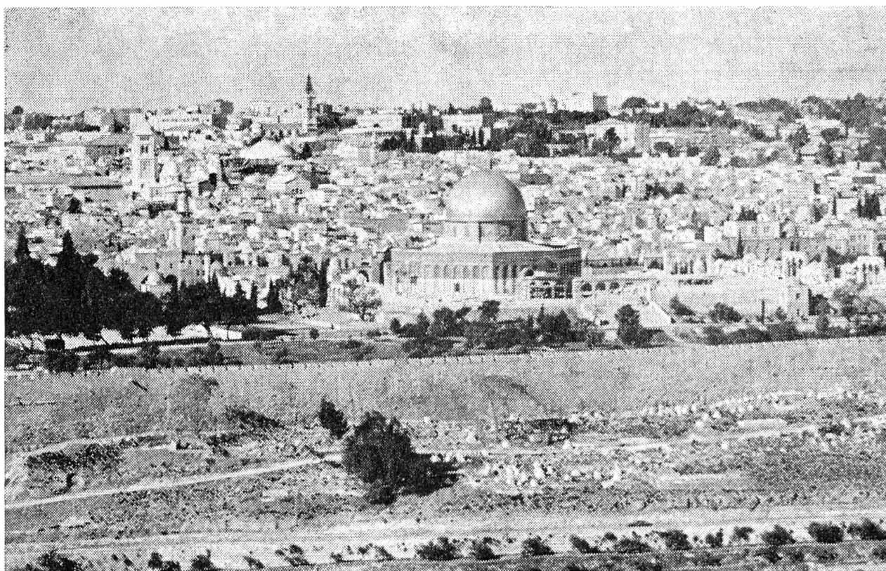
Unser Bild ist auf dem Ölberg aufgenommen. Es zeigt den jordanischen Teil Jerusalems, die Altstadt mit den heiligen Stätten der Bibel. Im Vordergrund die berühmte Omar-Moschee auf dem Platze, wo einst der Tempel stand.

lassen. Es zerstreute sich in aller Welt. In den fremden Ländern mußten die Juden im Laufe der Jahrhunderte viel leiden. Sie wurden immer wieder verfolgt, gequält, ausgeraubt und in manchen Ländern fast ganz ausgerottet. — In den östlichen Ländern (Rußland, Polen usw.) blieben die Juden bis in die Neuzeit meist arme, verachtete und rechtlose Menschen. In den westlichen Ländern ging es ihnen allmählich besser. Sie wurden gleichberechtigte Bürger ihres neuen Heimatlandes. Viele Juden wurden sogar reiche, sehr reiche Leute. Sie sind als leitende Männer in der Industrie, im Handels- und Transportwesen tätig. Auch in der Wissenschaft und in der Kunst gibt es viele tüchtige und berühmte Juden. — Aber der Haß und das Mißtrauen gegen die Juden ist auch im Westen nie ganz verschwunden. In der schrecklichen Zeit vor und während des Zweiten Weltkrieges wurden sie in Deutschland verfolgt, rechtlos gemacht,