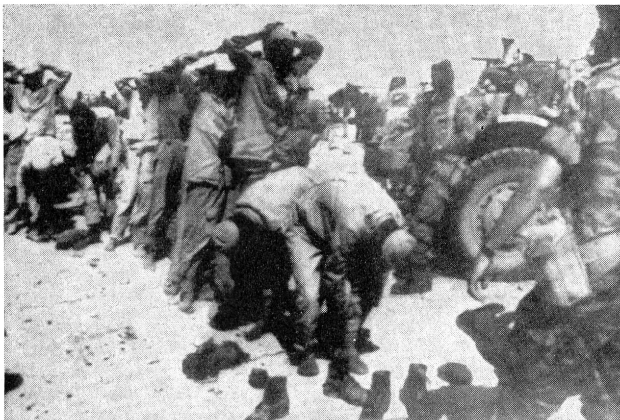
Gefangene ägyptische Soldaten in der Wüste Sinai. Sie müssen die Schuhe wieder anziehen, die sie ausgezogen hatten, um schneller fliehen zu können.

Jordanien, dann Ägypten und zuletzt auch Syrien mußten ihre Niederlage zugeben. Sie mußten mit einem Waffenstillstand einverstanden sein. Aber bedeutet das schon, daß im Nahen Osten der Kriegs-