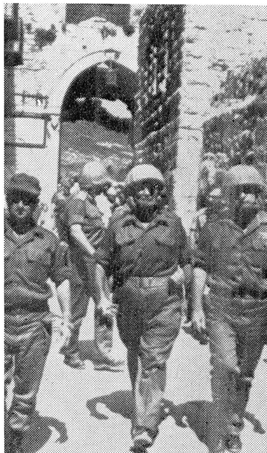
Der israelitische Verteidigungsminister (Mitte) schreitet mit zwei Generälen durch ein Tor in die soeben eroberte Altstadt Jerusalems.

Diese kriegerischen Worte rief Radio Kairo am frühen Morgen des 5. Juni 1967 den arabischen Völkern im Nahen Osten zu. Sie kündeten den Beginn des Krieges gegen Israel an. — Dieser Krieg kam nicht