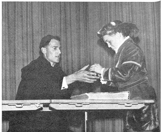
Eine Schulstunde bei Pedro de Ponce.