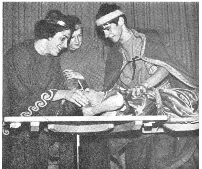
Bei der Zungenoperation eines taubstummen Knaben.

Das zweite Bild zeigt: Der spanische Mönch Pedro de Ponce lehrte im 16. Jahrhundert in einem Kloster taubstumme Knaben mit Gebärden und einem Fingeralphabet schreiben und «stumm» lesen. Das Ablesen vom Munde kannte man noch nicht.