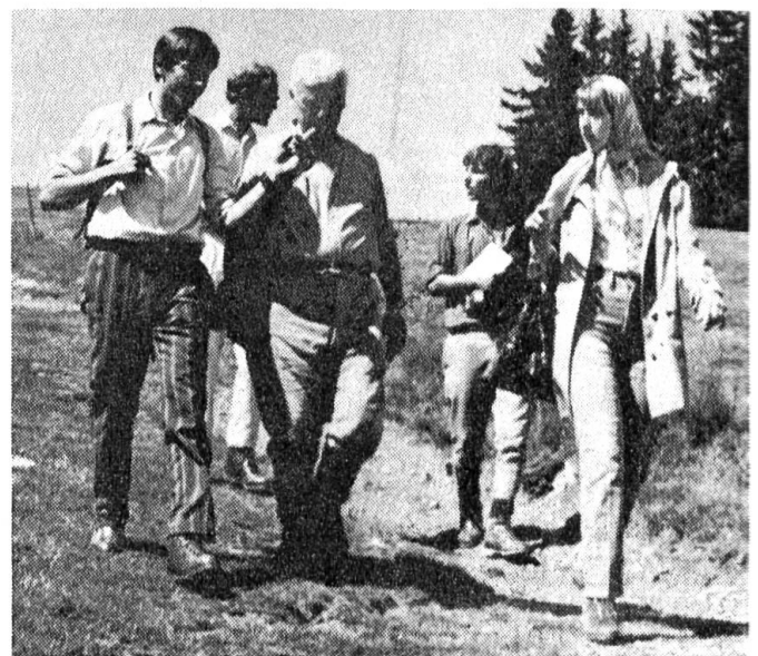
«Rigi-Bergstürmer» auf dem Heimweg. — Jugendlager Weggis 1970.