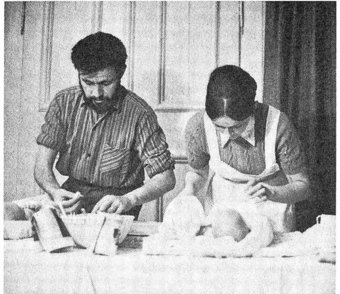
Kurs «Pflege von Mutter und Kind» — auch der moderne Mann muss etwas davon verstehen.