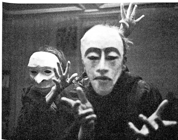
Pantomimen-Arbeit mit Masken: Neue Aufgaben — neue Möglichkeiten.