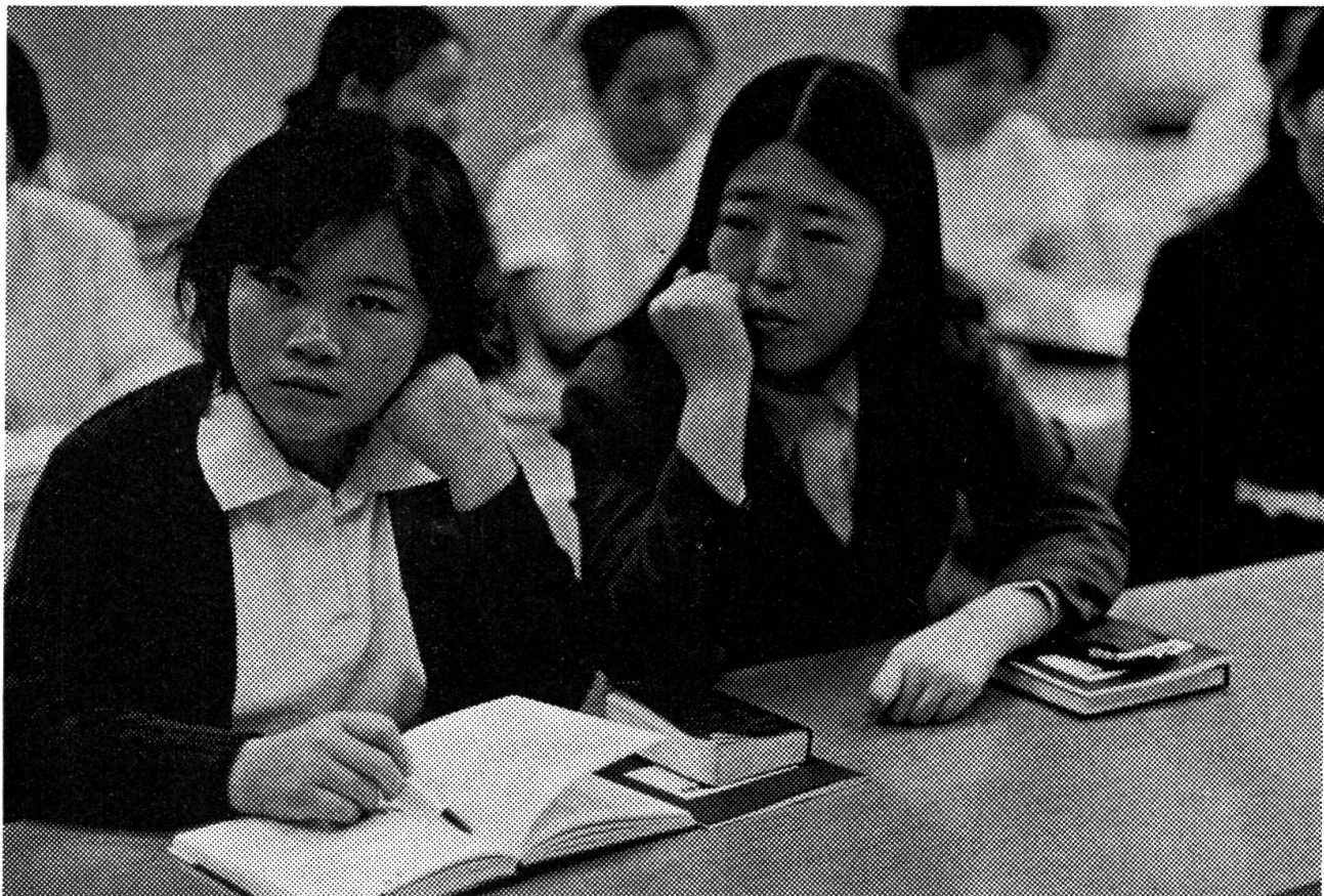
Die Koreanerinnen sind fleissige und lerneifrige Schülerinnen.

Die meisten Koreanerinnen stammen aus kinderreichen Familien. Sie sind froh, dass sie in der Fremde arbeiten dürfen. Denn in