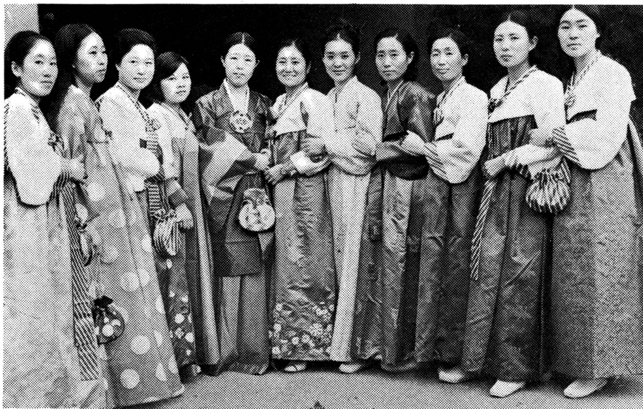
Die Koreanerinnen in ihren Landestrachten