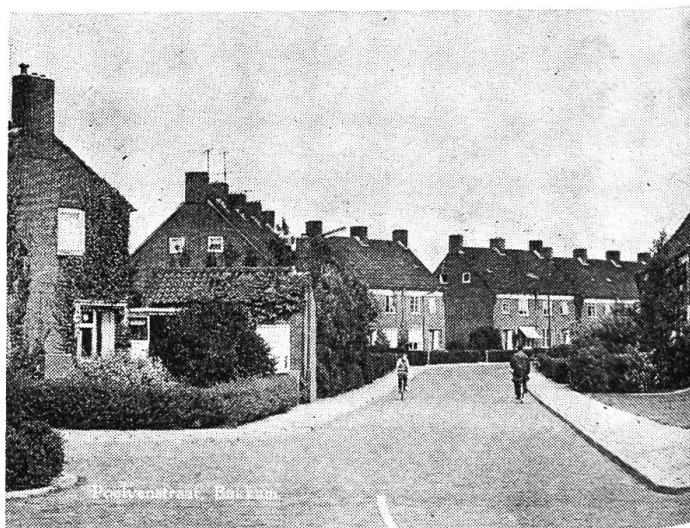
In Bakkum/Castricum. Alle Häuser sind aus braunen Backsteinen gebaut.