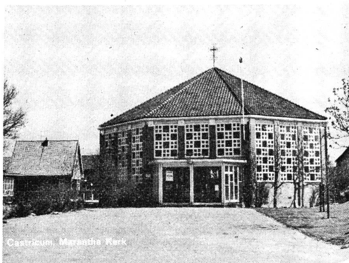
Marantha Kerk in Castricum.