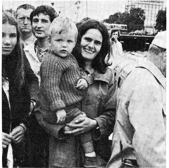
Lachende Gesichter unserer Reisegesellschaft bei den Amsterdamer Grachten.