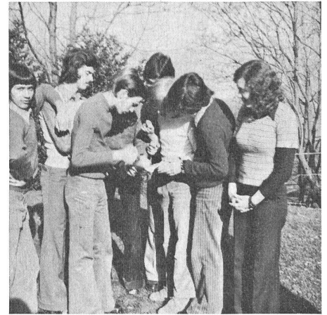
Was gibt es da wohl zu schauen?