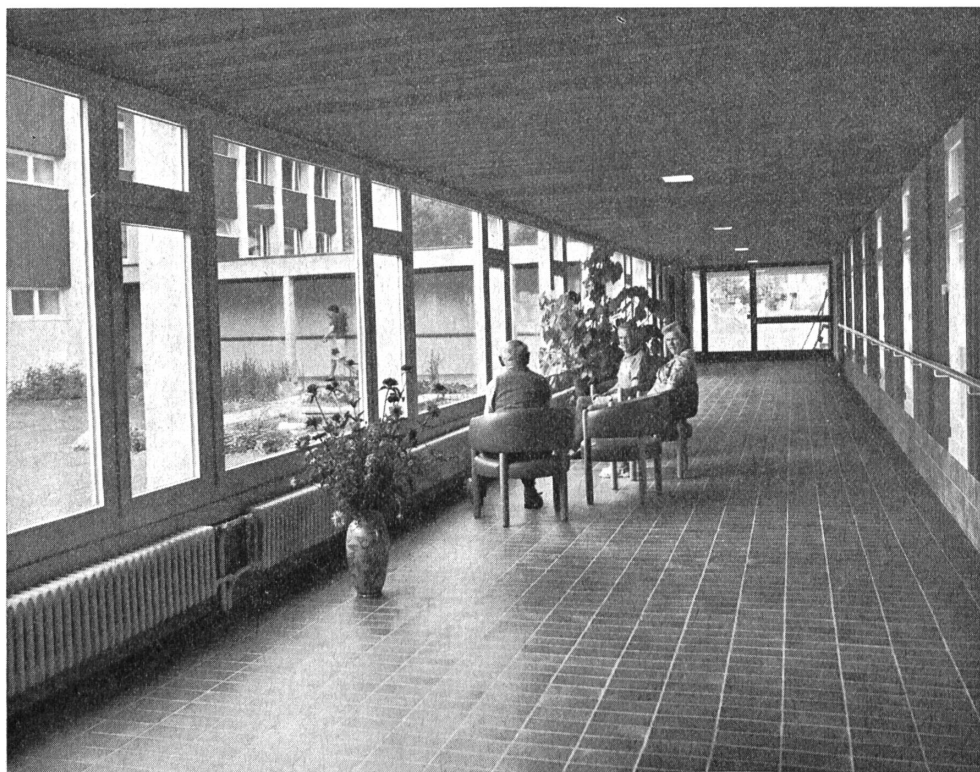
Der geräumige Verbindungsgang ist zum Ort der Begegnung geworden. Hier trifft man sich zu einem Schwatz; hier ist immer etwas zu sehen.

Damit dieser Bericht nicht zu lange wird, möchten wir heute das Neugeschaffene nur in einigen Bildern vorstellen. Nähere Einzelheiten über einen Rundgang durch Werkstätten und Heim werden wir später im Bericht über den «Tag der offenen Tür» erzählen, zu dem in erster Linie alle Gehörlosen herzlich eingeladen sind. Er findet statt am Sonntag, den 17. November 1974.