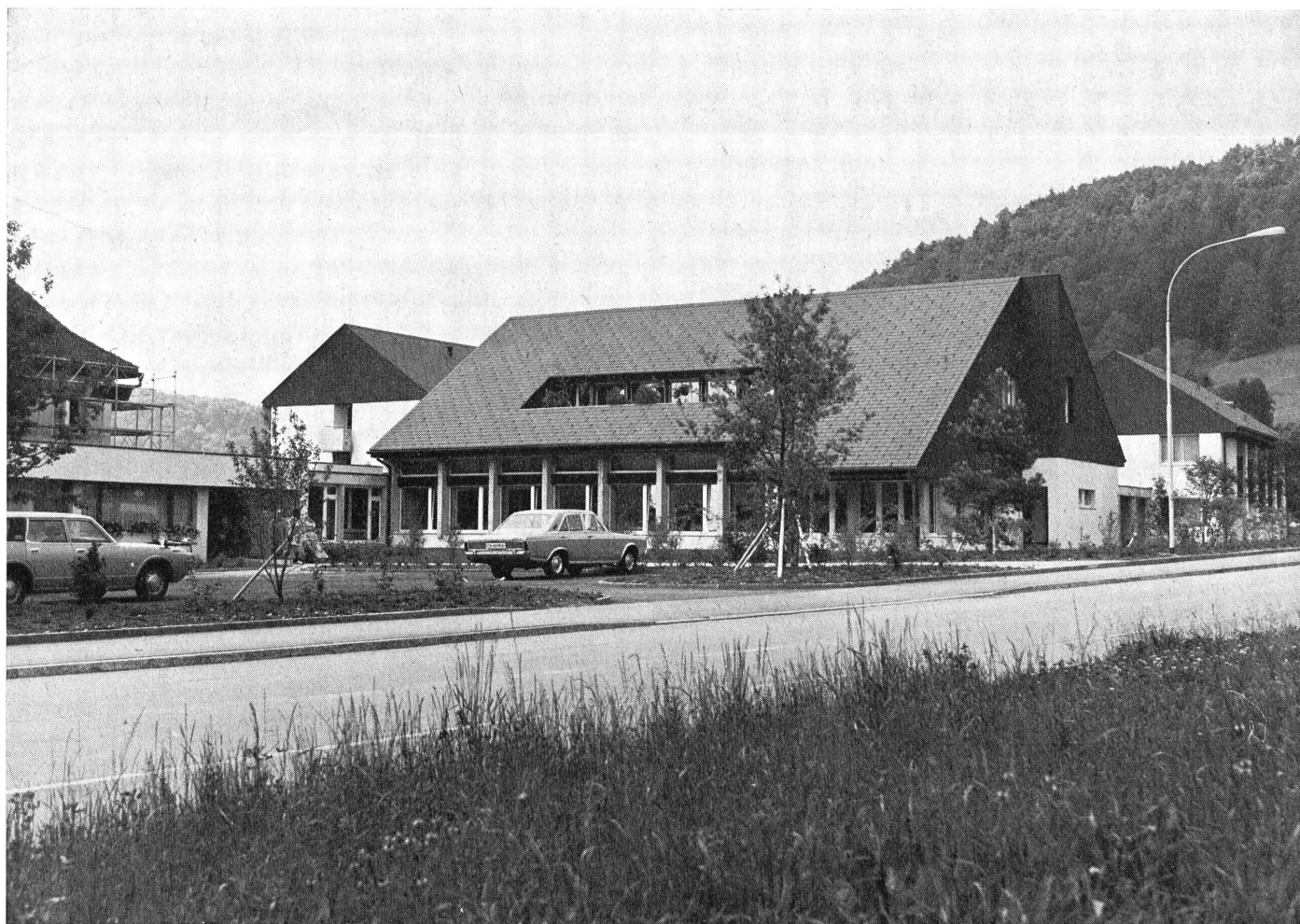
Blick auf das neue Heim von der Zufahrt her.

Seither heisst die Institution kurz: «Schloss Turbenthal». Und damit niemand etwa meint, dies sei der Name einer Ausflugswirtschaft, ist noch der Untertitel «Werkstätten und Heim für Hörbehinderte» hinzugefügt worden.