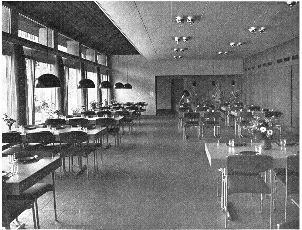
Blick in den farbenfrohen Speisesaal. Er ist ohne Unterteilung gestaltet, um den Gehörlosen das Ableben zu erleichtern.

— die Freizeit für alle sinnvoll gestalten.