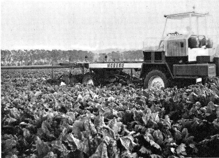
Modernste Zuckerrüben-erntemaschine im Einsatz.

bevölkern, desto mehr Zucker braucht es. Es ist ganz ähnlich wie beim Getreide. Darum ist auch das Brot wieder teurer geworden. Wenn von einer Ware zu wenig vorhanden ist, dann muss man mehr für sie bezahlen.