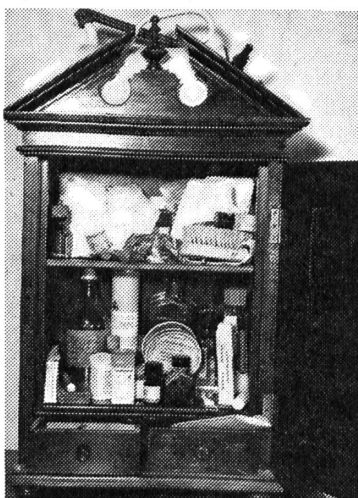
Wie sieht es in Deiner Hausapotheke aus?

ten oder verunmöglichten sogar das rasche Löschen von kleinen Bränden. «Estriche entrümpeln!» hiess es damals. Und jetzt heisst es: «Hausapotheke entrümpeln.» In der Regel findet man in jedem Haushalt so eine kleine Apotheke. Manchmal sieht es darin so aus wie in der abgebildeten Hausapotheke aus Grossmutter's Zeiten. In Flaschen, Fläschchen, Schachteln und Tuben werden da die verschiedensten Medika-