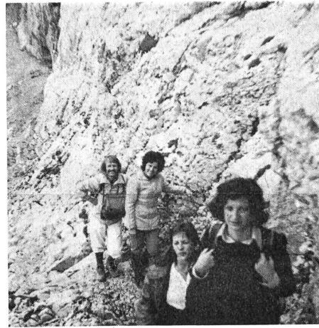
Lernen einige bergungewohnte Wanderer das Fürchten?