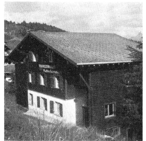
Haus zum «Matterhornblick» auf Bettmeralp.