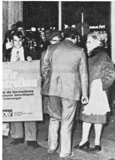
Streikposten umstellen die Hamburger Staatsoper. Rechts empörte Besucher, die keinen Einlass erhielten.

Die BRD ist ein Nachbarland, wo bis jetzt bedeutend weniger gestreikt worden ist als in Frankreich und in Italien. Aber nun droht auch in der BRD ein grosser Streik der Angestellten der Öffentlichen Dienste (PTT, Bahnen usw.). Ihre Gewerkschaften fordern eine Lohn-erhöhung von 15 Prozent. Die Regierung will aber nur zirka 10 Prozent bewilligen. Bis zur Stunde weiss man noch nicht, wie dieser Verhandlungskrieg enden wird.