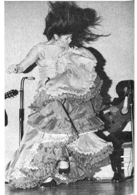
«La Singla» tanzt einen wilden «Flamenco». Fast zornig wirft sie den Kopf zur Seite, um die langen Strähnen ihrer Haare aus dem Gesicht zu schleudern.