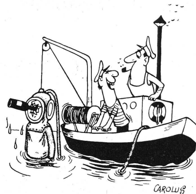
«Ich weiss nur, dass er plötzlich einen Korkenzieher verlangte.»

Winterthur. Voranzeige. Die ausserordentliche Versammlung findet am 7. Juni statt. Der Vorstand