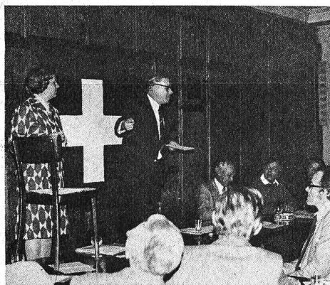
Präsident Brielmann in voller Aktion.