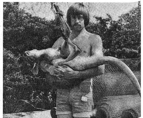
Das schlafende Känguruh wird sanft ins Gehege zurückgetragen.