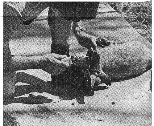
Die Mundhöhle wird beleuchtet, um das Wachstum der Zähne zu kontrollieren.