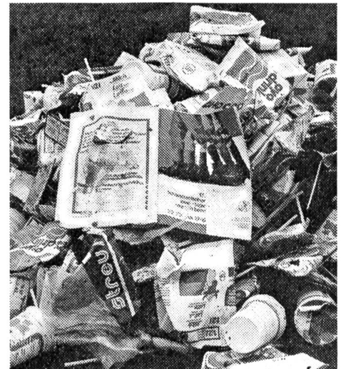
Es gibt sehr viele kleine Sünder

Das sind immer sehr erfreuliche Aktionen. Aber alle diese Freiwilligen machen einen Fehler gut, den gedankenlose und verantwortungslose andere Leute verursacht haben. — Besonders grosse Sünder der Umweltverschmutzung werden hie und da erwischt und können dann bestraft werden. Doch die vielen kleinen Sünder bleiben straflos.