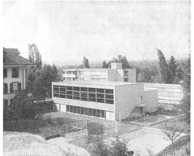
Teilansicht von der Südseite mit Turnhalle und Schwimmbad

Aus dem einfachen Aufbau der früheren Zeit ist also eine vielgliedrige Organisa-