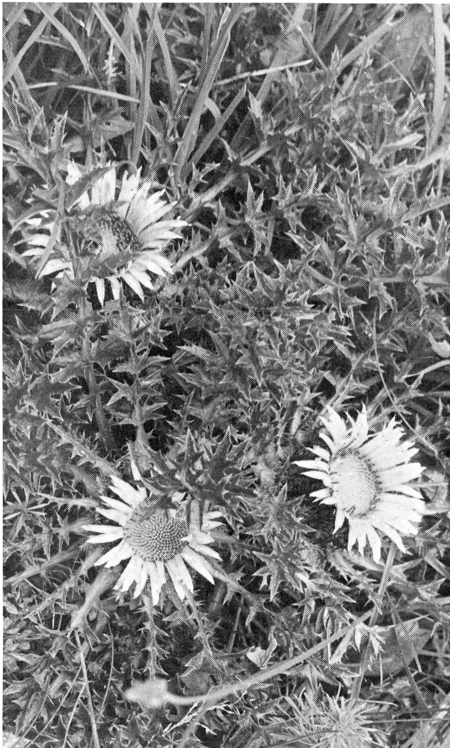
Silberdisteln-Sterne in den Bergmatten

Von Anfang an wurde der Bau mit speziellen Einrichtungen für taube Menschen ausgerüstet. Wenn z. B. ein Besucher in der Eintrittshalle auf den Knopf drückt, dann ertönt in der Wohnung kein Glockenzeichen, sondern es leuchtet ein