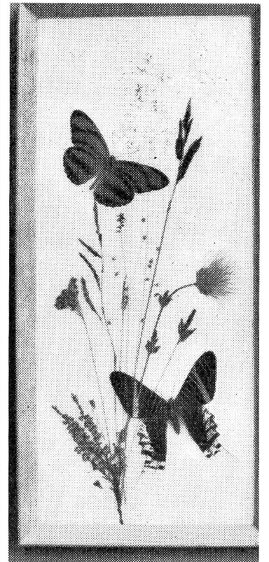
Eines der reizenden Blumenbilder.