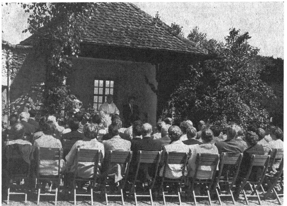
Stimmungsvoller und eindrücklicher ökumenischer Gottesdienst im Garten des Stapferhauses.