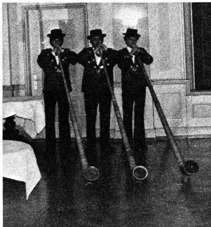
Mächtig dröhnten die Melodien im Saal ...

Die Verbandstagung nahm einen guten und schönen Verlauf. Die Gemeinschaft