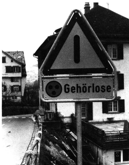
Gefahrensignal «Achtung Gehörlose».

Das heute 200jährige Patrizierhaus ist dreistöckig. In den beiden obersten Stockwerken befinden sich die Zimmer der Pensionäre. Mehrheitlich sind es Zwei- bis Drei- oder Drei- bis Vierbettzimmer. Einzelne Zimmer mit ihren schönen und teilweisen bruchfälligen Fresken deuten darauf hin, dass es sich um ein ehrwürdiges Gebäude handeln muss, das auch eine baldige Teilrenovation nötig hat. Die Männer wohnen im zweiten Stock und die Frauen ein Stockwerk tiefer. Die Pensionäre geben sich alle Mühe, ihre Zimmer möglichst farbenfroh und ori-