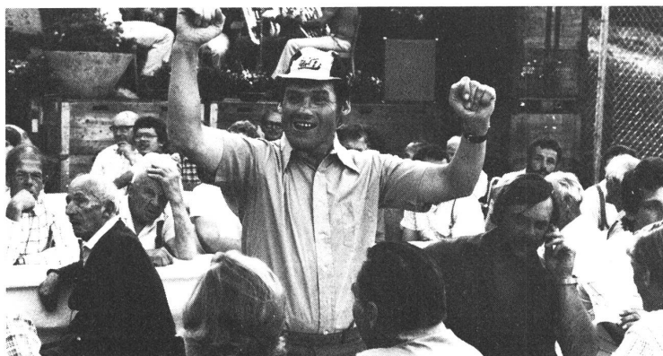
Freude eines Hörbehinderten.