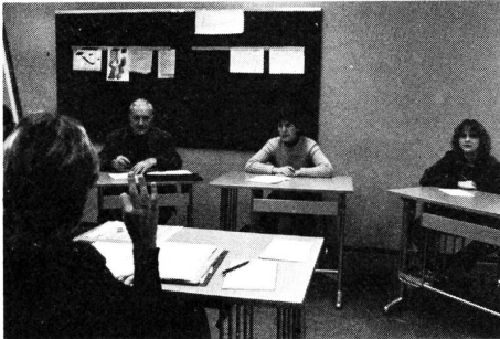
Unterricht im Gehörlosenzentrum

Es wird im Fernsehen «Sehen statt Hören», in den Gehörlosenschulen, in den Sprachbehindertenschulen, in den Heimen für Blinde und