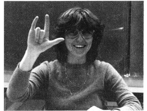
I love you

Das Internationale Fingeralphabet ist eine Ver-