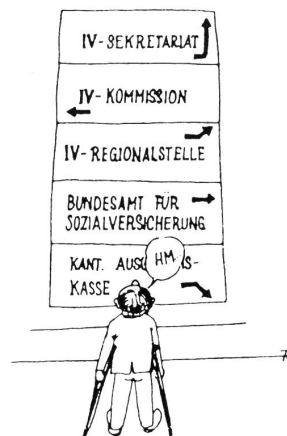
F. Lohri, in: «Behindert – was tun?»

Das IV-Sekretariat, die IV-Kommission und die IV-Regionalstelle sollen zu einem einzigen Organ zusammengefasst werden: der IV-Vollzugsstelle. Damit würde das bisherige «Milizsystem» (die Mitglieder der IV-Kommissionen sind nebenamtlich tätig) durch eine Fachstelle mit vollamtlichen Mitarbeitern abgelöst.