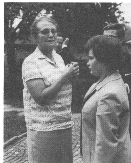
Auch in der Freizeit bei den Gehörlosen.

Ende Juni 1974 hatte sie während eines Badesonntages mit ehemaligen Schülern mitten im Geschichtenerzählen eine Streifung. Sie erholte sich nicht mehr ganz und musste nach den Sommerfe-