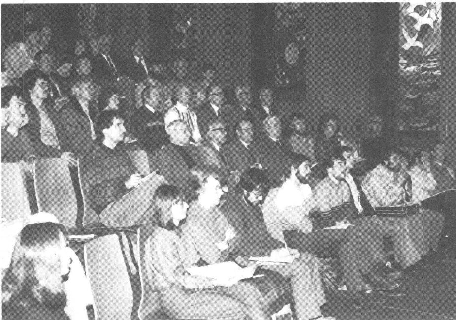
Aufmerksam und voll konzentriert: die Tagungsteilnehmer.