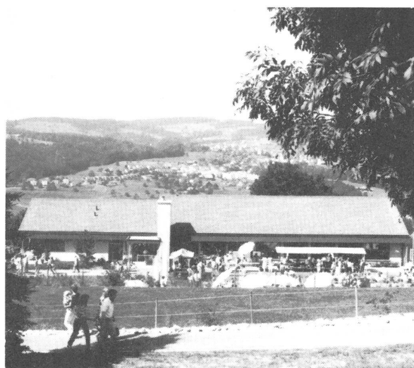
Der Neubau von der Südseite lässt den Blick auf die Landschaft offen.