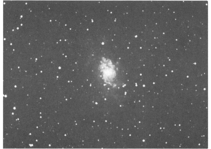
Spiralnebel im Sternbild Dreieck.

heissen darum mythologische Sternbilder. Wir kennen zum Beispiel die Sternbilder Stier, Orion, Cassiopeia, Löwe, Krebs, Zwillinge usw. An unserem nördlichen Sternhimmel gibt es 57 Sternbilder. Diese bestehen aber aus vielen verschiedenen Sternen, die teils weit auseinanderliegen und nichts miteinander zu tun haben, aus veränderlichen Sternen, Doppelsternen und interstellarer Materie (Gasnebel im Orion). Sterne sind selbstleuchtende, sonnenähnliche Himmelskörper, die 100mal kleiner bis 3000mal grösser als unsere Sonne sein können. Unsere Sonne ist also ein mittelgrosser Stern im Weltall. Je nach Temperatur strahlen die Sterne verschiedenfarbiges Licht aus. In der Einteilung der Sterne spricht man dann von roten oder weissen Zwergen, roten oder blauen Riesen oder blauweissen Überriesen.