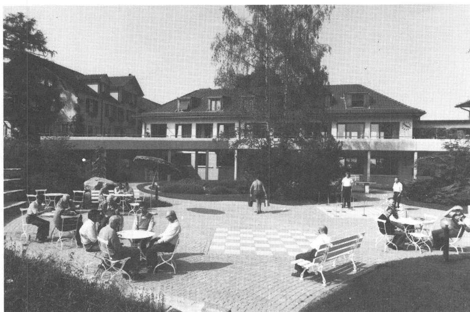
Innenhof mit Seitentrakt des alten Wohnheims. Wen gelüftet es da nicht, spontan zuzusitzen?