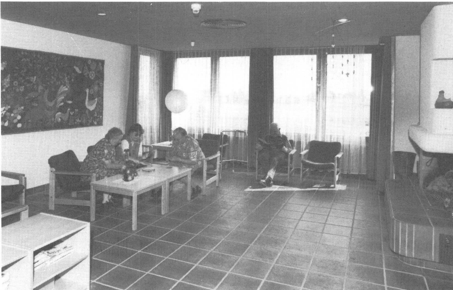
Der geräumige Aufenthaltsraum lädt ein zu gemeinsamem Tun.