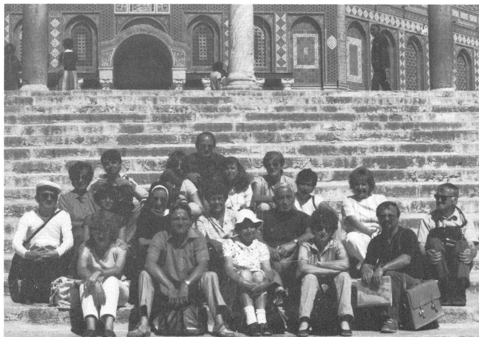
Die Reisegruppe vor der Omar-Moschee in Jerusalem