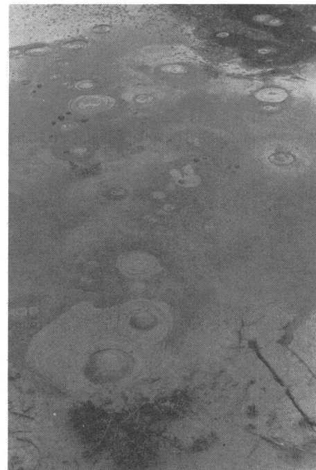
Es kocht und brodelt: Schwefelquellen in Rotorua.

Im Hauptgebiet Whakarewarewa faszinierten mich die Gasblasen, die durch den Schlamm aufstiegen und platzten, manchmal regelmässig, manchmal überraschend, aber immer un-