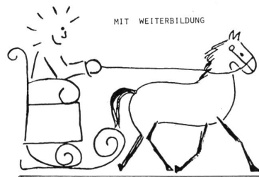
Die Illustration von Herrn Baur zeigt: Mit Weiterbildung geht's leichter – auch in die Zukunft.