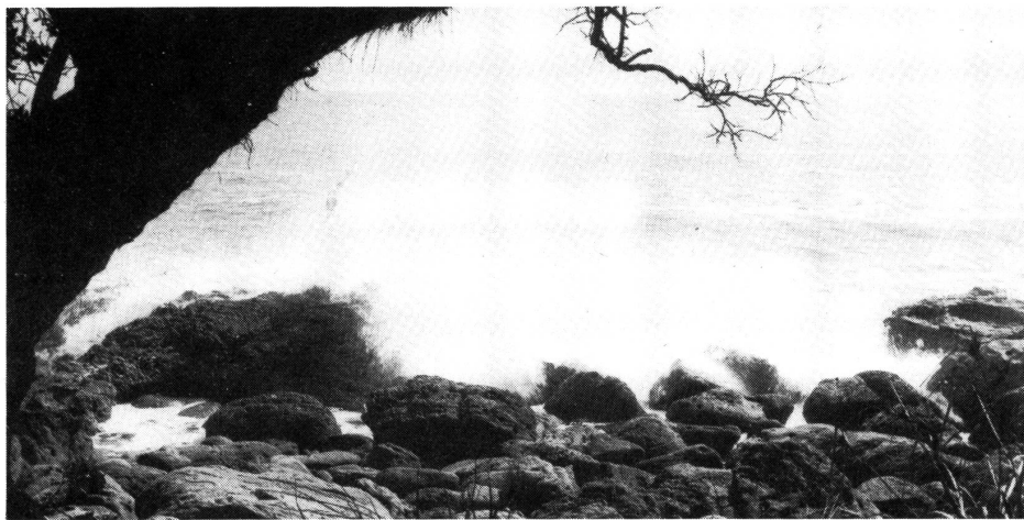
Hoch spritzen die Wellen über die Felsen am Mount Maunganui in der Nähe von Tauranga.

Wir fuhren nochmals nach Rotorua und besuchten dort eine Schafschau. Die 19 wichtigsten Schafrassen waren hier ausgestellt. Der Vorführer verstand seine Arbeit. Er zeigte auch, was ein Hirtenhund zu leisten vermag. Es war ganz erstaunlich, wie ihm seine beiden Hunde auf jeden Pfiff gehorchten. Er konnte ihnen jeden Schritt, vorwärts, rückwärts, seitwärts, mit verschiedenen Pfiffen befehlen. Dann schor er noch ein Schaf: In weniger als zwei Minuten war das ganze Schaf fein säuberlich geschoren! In der Nähe von Rotorua liegen der Blaue See und der Grüne See. Auf den Postkarten waren die Seen wirklich blau und grün. Aber als wir dort picknickten, war der See – der blaue oder der grüne? – einfach dunkel. Die Binsenhalmespiegelten sich am Rand, wo der See noch hell war. In der dunklen Mitte lag eine goldene Insel: Die herbstlichen Blätter leuchteten wirklich wie Gold. Es begann zu tröpfeln. Viel schlimmer aber als der Regen waren die Stechfliegen. Die waren so zahlreich wie die Regentropfen. Schliesslich flüchteten wir in das Auto. Da waren wir die Fliegen los! Fortsetzung folgt