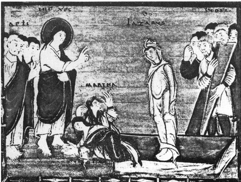
Der Mensch kann sich das Neue Leben nicht selber geben. Er muss – wie Lazarus – dazu erweckt werden.

Schild am Eingang eines Geschäftes in Marseille: «Heute ist ein zu schöner Tag, um Geschäfte zu machen. Folgen Sie meinem Beispiel: Gehen Sie ans Meer, geniessen Sie den Tag, und essen Sie am Abend etwas besonders Gutes. Morgen bin ich dann wieder für Sie da. Auf Wiedersehen!»