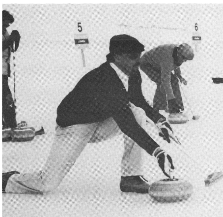
Abgabe des Steins – volle Konzentration.

Zahlreiche Legenden deuten darauf hin, dass bereits im 16. und 17. Jahrhundert im schottischen Hochland Curlingklubs existierten. Über den Ursprung des Curlings in der Schweiz herrscht etwas Verwirrung. Im Winter 1880/81 sollen zwar von englischen Kurgästen zwei Curlingsteine nach St. Moritz gebracht worden sein, doch die ersten Klubs wurden erst ein paar Jahre später gegründet, wobei vor allem die Briten