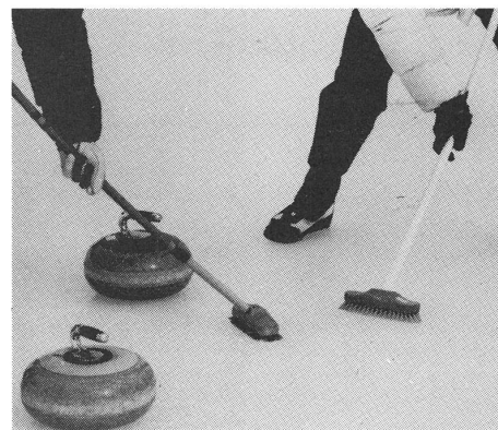
«Ziehen» des Steins mit schottischen Besen.

Spätestens nach den Weltmeisterschaften 1964 in Bern, als die Schweizer Curler aus dem Schattendasein traten und in die Phalanx der absoluten Weltspitze eindringen konnten, aber auch das Fernsehen Bilder vom Spiel mit Steinen und Besen live in unsere Stuben brachte, waren bald die letzten Zweifel beiseite geschoben, ob Curling nur ein gemütlicher Zeitvertreib sei. Ein