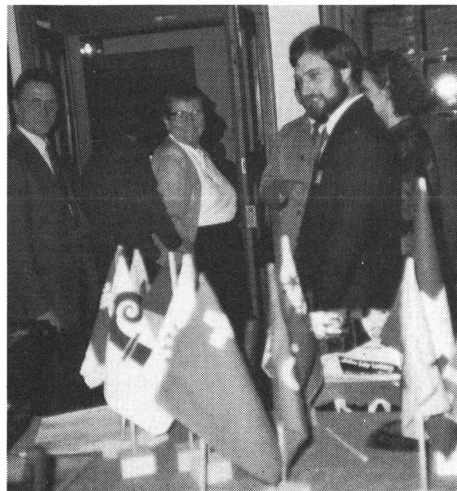
Die Standarten stehen bereit – die DV kann beginnen – der Präsident scheint zufrieden.