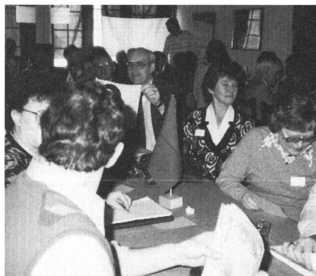
Gedrängt, aber gut gelaunt an der DV.