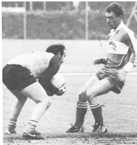
... eine der vielen verpassten Chancen St. Gallens.