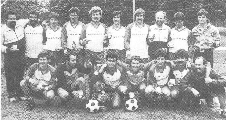
Luzerns erfolgreiche Mannschaft in Siegerlaune...

Der 13. Cupfinal war geprägt von zwei verschiedenen Halbzeiten. Zuerst dominierte der viermalige Cupgewinner GSC St. Gallen das Geschehen, dann übernahm der GSV Luzern die Initiative und entführte zuletzt, wie schon in den Jahren 1982, 1983 und 1985, die begehrte Cuptrophäe in die Innerschweiz.