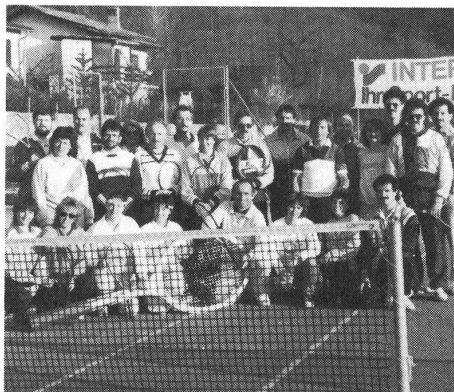
Die Teilnehmer in Cadro.