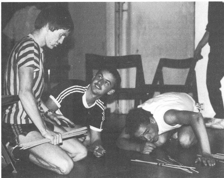
Freude und Konzentration beim Mikadospiel.

Vom 19. Juli bis zum 2. August führte der Schweizerische Gehörlosenbund in Zusammenarbeit mit der Arbeitsgemeinschaft der Sozialarbeitsleiter zum vierten Male ein Jugendlager durch. Die fünf gehörlosen und zwei hörenden Kursleiter boten den jugendlichen Teilnehmern zwischen 17 und 26 Jahren im malerischen Magliaso ein vielseitiges Ferienprogramm an.