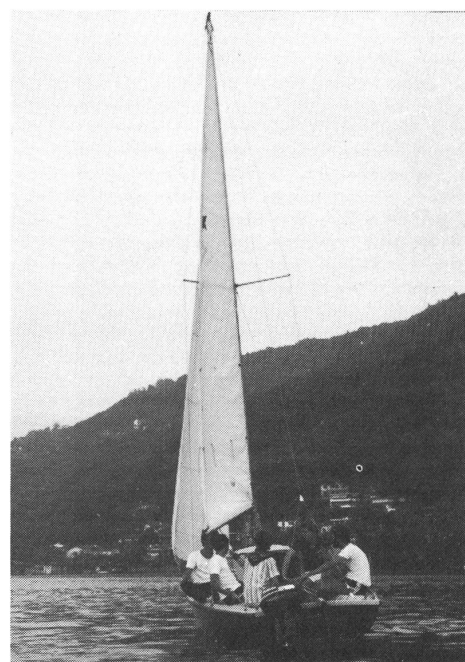
«Piraten» auf hoher See suchen ein Schiff zum Ausrauben!

Allen, die zur Verwirklichung beigetragen haben, möchten wir hier danken. Dem Leiterteam, dem SVG, der AGS. Es war eine schöne, spannende, aber auch lehrreiche Zeit – Ferien, wie jeder davon träumt. Ruedi Graf