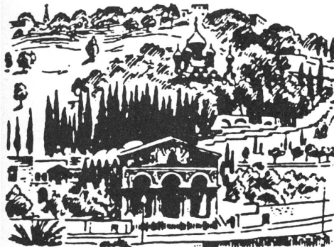
Der Ölberg mit Gethsemane

Nach der Besichtigung der zwölf prächtigen Fenster von Marc Chagall in Hadassah ging es weiter nach Yad Vaschem, dem Judenverfolgungsmuseum. Am Vormittag spazierten wir vom Ölberg durch die Via Dolorosa zum Stephanstor hinunter. Am Nachmittag besuchten wir den Park mit dem Ruinenstädtchen Bethesda. Nach den Besichtigungen der Geiselungskapelle, der Urteilskapelle und des «Ecce-Homo-Bogens» liefen wir zur Grabeskirche. Dort sahen wir das Grab des heiligen Jesu. Vom Turm der Erlöserkirche aus genossen wir die schöne Rundschau auf Jerusalem. Nachher hatten wir bis 18.30 Uhr freien Ausgang in die Altstadt Jerusalem. Der Chauffeur führte uns zu einem Restaurant, wo wir ein feines Nachtessen bekamen. Der Tisch war schön geschmückt, und man merkte, dass hier mit viel Liebe gekocht wird.