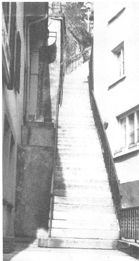
Ein neuer Weg beginnt. Wohin führt er? Was bringt er uns? Wir werden es erfahren, wenn wir voll Zuversicht heute den Fuss auf die erste Stufe setzen.

Das Monatsblatt BSSV, Heft 12/1985, bringt eine 18seitige Sonderbeilage über die neusten technischen Hilfsmittel für Hörbehinderte. Es werden vorgestellt: optische Hilfsmittel (Lichtsignalanlagen für Haustüre und Telefon, Blinkwecker, Babyfunk, Schreibtelefone und Teletext), akustische Hilfsmittel (elektronische Hausglocke, Ringleitungen und weitere Verstärkeranlagen für Radio und Telefon) sowie weitere Geräte (zum Beispiel zum Schutz des Gehörs oder der Hörgeräte).