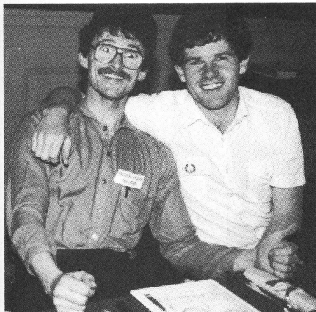
Die Fussballer aus Irland in Hochstimmung...