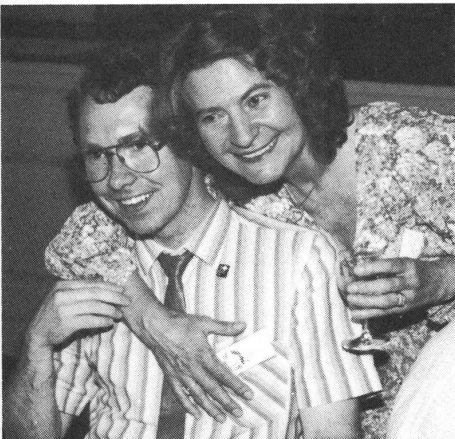
Gute Stimmung ist ansteckend