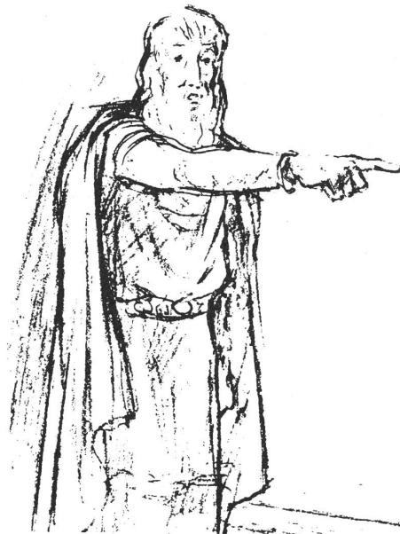
«Du bist der Mann!»

Bei uns erhalten alle Gegenden des Landes genügend Regen; überall – bis ins hohe Gebirge – können Pflanzen wachsen.