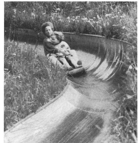
Mit der Rutschbahn rassig zu Tal.

Atzmännig, an der Peripherie des sanktgallischen Linthgebietes und des Zürcher Oberlandes gelegen, bietet eine Attraktion für jung und alt: Auf einem Rutschschlitten können sie gefahrlos durch Tunnels und über Bachübergänge kurvenreich zu Tal sausen. Die Fahrtgeschwindigkeit bestimmen sie dabei selbst. Der ganze Spass hat aber auch seinen Preis: Ein Rutschbahnabonnement kostet 16 Franken und berechtigt Erwachsene zu fünf Fahrten und Kinder zu zehn Fahrten. Inbegriffen im Preis ist die Bergfahrt mit der Sesselbahn zur Mittelstation. Hier können Sie den Rutscher in Empfang nehmen. Die Rutschbahn (700 Meter) ist nur bei trockenem Wetter geöffnet, und zwar von 9.00 bis 11.45 Uhr und von 13.15 bis 17.30 Uhr. Kinder unter acht Jahren müssen in Begleitung mit einem Doppelschlitten rutschen. Ein Kleintierpark und ein Kinderspielplatz sowie ein Gartenrestaurant bei der Talstation der Sesselbahn, aber auch zahlreiche markierte Wanderwege vervollständigen das Angebot Atzmännig als lohnendes Ausflugsziel. Man erreicht Atzmännig von Rapperswil kommend via Eschenbach, Goldingen, Hintergoldingen.