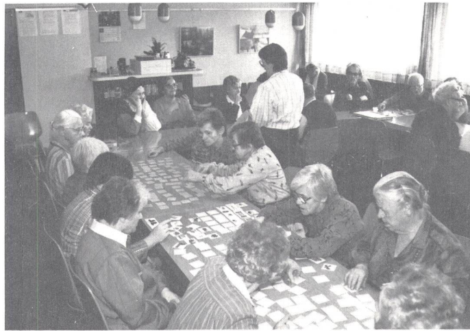
Hier wird eifrig gespielt und geplaudert.

Es wird von der Beratungsstelle für Gehörlose Zürich organisiert und findet einmal im Monat, an einem Mittwochmittag, von 14 bis 17 Uhr, statt.