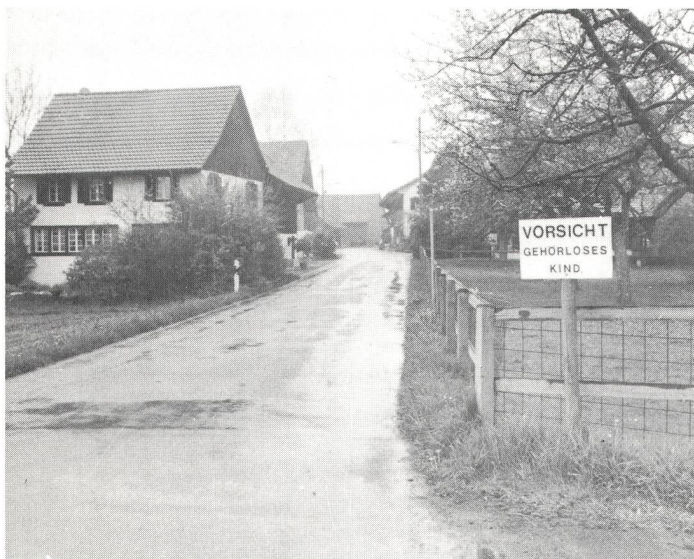
Das ungewöhnliche Schild im Strassenverkehr.