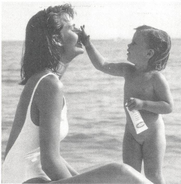
Auch Mami darf keinen Sonnenbrand bekommen!

(wag) Die Gefährlichkeit der Sonnenbestrahlung wird uns immer mehr bewusst. Um sich die Sonnenschutzcreme mit dem richtigen Schutzfaktor zu beschaffen, ist es wichtig, die Reaktion der eigenen Haut auf Sonneneinstrahlung zu kennen.